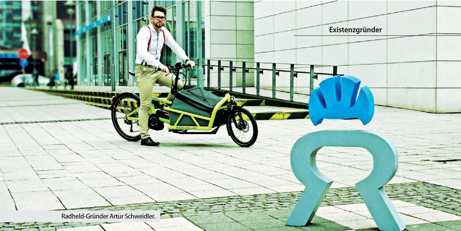
Radheld-Gründer Artur Schweidler.